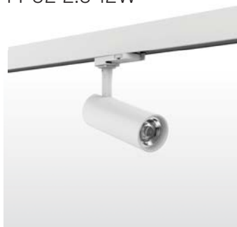
TT-02 2.0 12W

Светильники монтируются на 3х фазный шинопровод Varton™